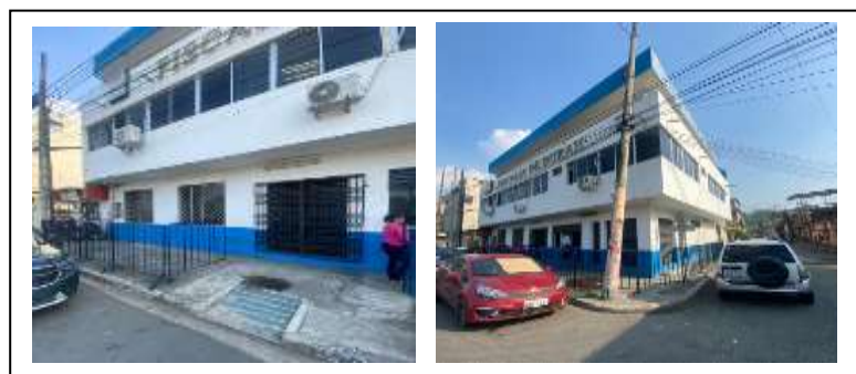
Figura 5. Fiscalía de cantón Durán

La adopción de esta medida se enmarca en las facultades institucionales orientadas a reforzar los controles de acceso, optimizar los procedimientos de verificación en áreas sensibles y fortalecer la seguridad externa de la dependencia.