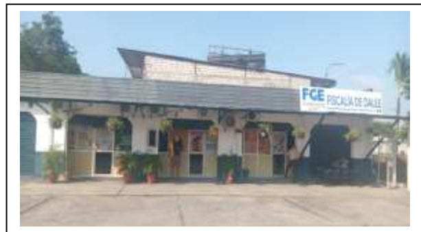
Figura 6. Fiscalía de cantón Daule

Las labores realizadas comprendieron acciones de readecuación, mantenimiento y mejoramiento de la infraestructura, tales como arborización, pintura general, adecuación del archivo y de los servicios higiénicos, entre otros trabajos orientados a garantizar un entorno funcional, digno y seguro para el ejercicio de las labores fiscales y administrativas.