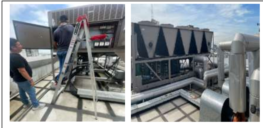
Figura 4. Equipos de climatización de edificio Montecristi