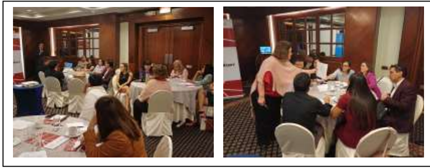
Figura 2. Jornada de Gestión Estratégica Sensible al Género