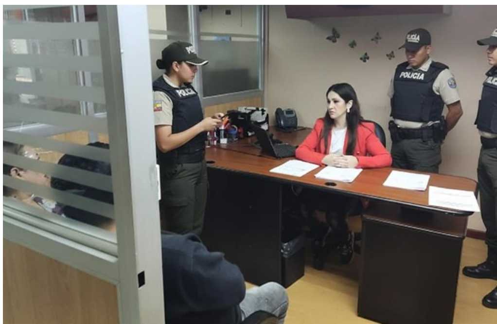
Ilustración 3 Atención en la SAI-AZOGUES

Fuente: SAI Azogues Elaboración: Fiscalía Provincial del Cañar