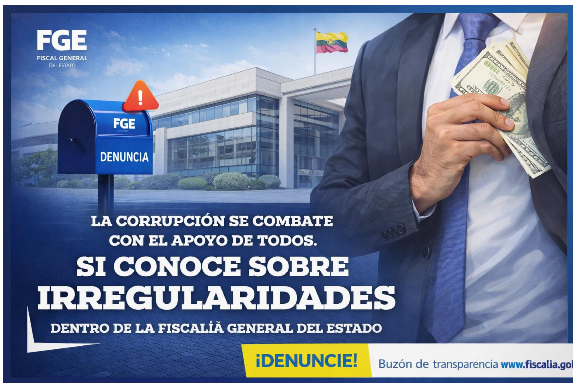
Ilustración 4 Letrero para promover denuncias hacia la ciudadanía

Fuente: Fiscalía General del Estado Elaboración: Fiscalía Provincial del Cañar