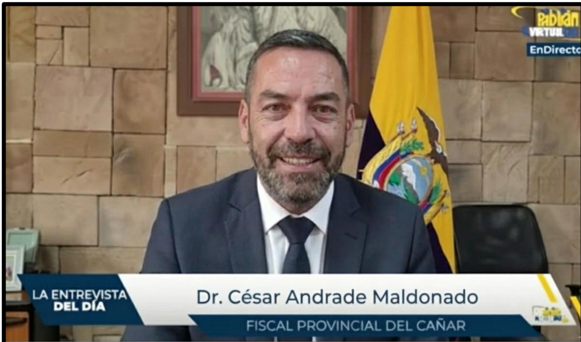
Ilustración 3 Entrevistas institucionales sobre casos de relevancia pública y alto impacto social

de preservar la legalidad de los procesos y la correcta administración de justicia.