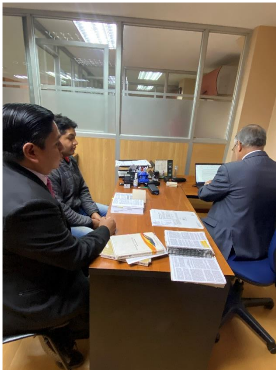
Ilustración 3 Atención en la SAI-AZOGUES

Con la implementación del orgánico por procesos, se vislumbro las funciones de cada uno de los servidores de una manera práctica, puesto que en base a ello se fortaleció y mejoró el desempeño de los servidores, lo que redundó en positivo sobre la atención a los usuarios externos.