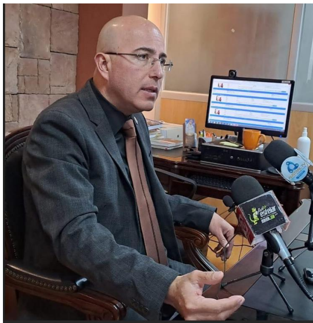
Ilustración 1 Entrevista para dar a conocer casos relevantes y de conmoción social

Mediante ruedas de prensa y acceso de la misma (prensa) a noticias sobre procesos; se ha dado a conocer a la ciudadanía sobre los niveles de eficacia de la Fiscalía en los procesos penales en desarrollo y de los logros de sentencias; esto siempre con apego a lo que la ley permite en cuanto a la publicación y acceso a la información sobre procesos penales.