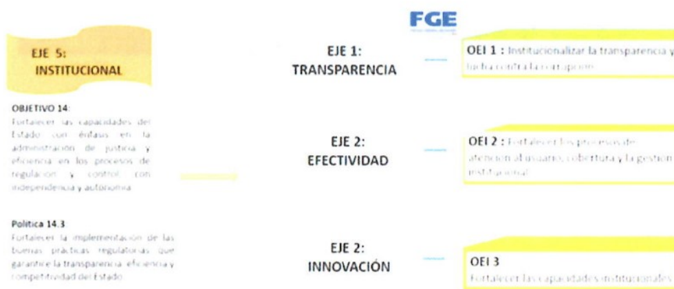
Ilustración 1. Alineación con el Plan Nacional de Desarrollo “Creando Oportunidades 2021-2025”

Con el propósito de contribuir con el cumplimiento de los principios establecidos en la Constitución de la República y alineados a los Objetivos de Desarrollo 2030, así como a los objetivos del Plan Nacional de Desarrollo y a los del Consejo de la Judicatura, la Fiscalía General del Estado desarrolló la siguiente ruta de alineación a través de su Plan Estratégico Institucional.