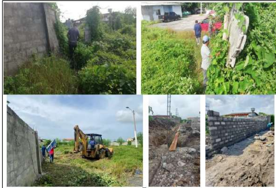
Figura 8. Construcción del cerramiento de la Fiscalía del cantón Playas (cubierto por la aseguradora)