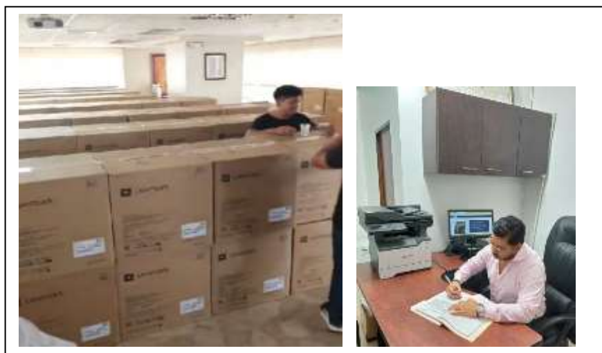
Figura 9. Adquisición de impresora Fuente: Unidad de Tecnologías de la Información y Comunicación Elaboración: Fiscalía Provincial del Guayas y Galápagos

En coordinación con Planta Central se logró la adquisición de 189 dispositivos multifunción (impresión, copiado y escaneo) forman parte de las herramientas informáticas a ser utilizadas por cada una de las Fiscales Especializadas y Fiscalías Multicompetentes como parte del nuevo modelo de gestión que incluye el manejo del expediente electrónico.