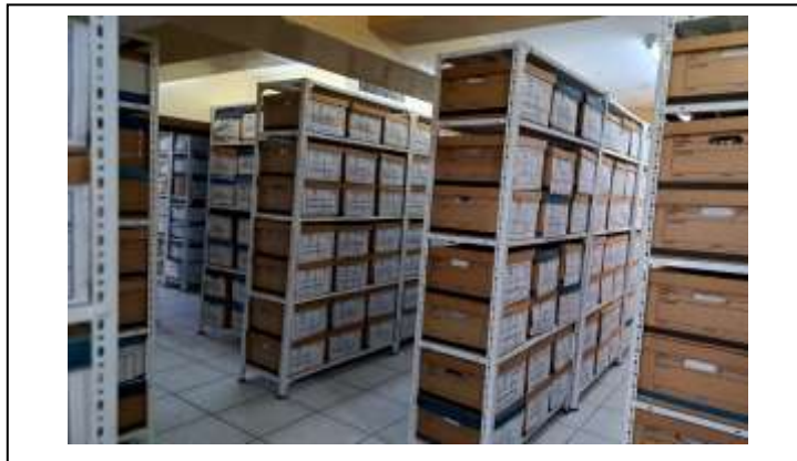
Figura 3. Primer piso de la dependencia de La Garzota

Se ha avanzado con el 90% de organización y clasificación de contenedores.