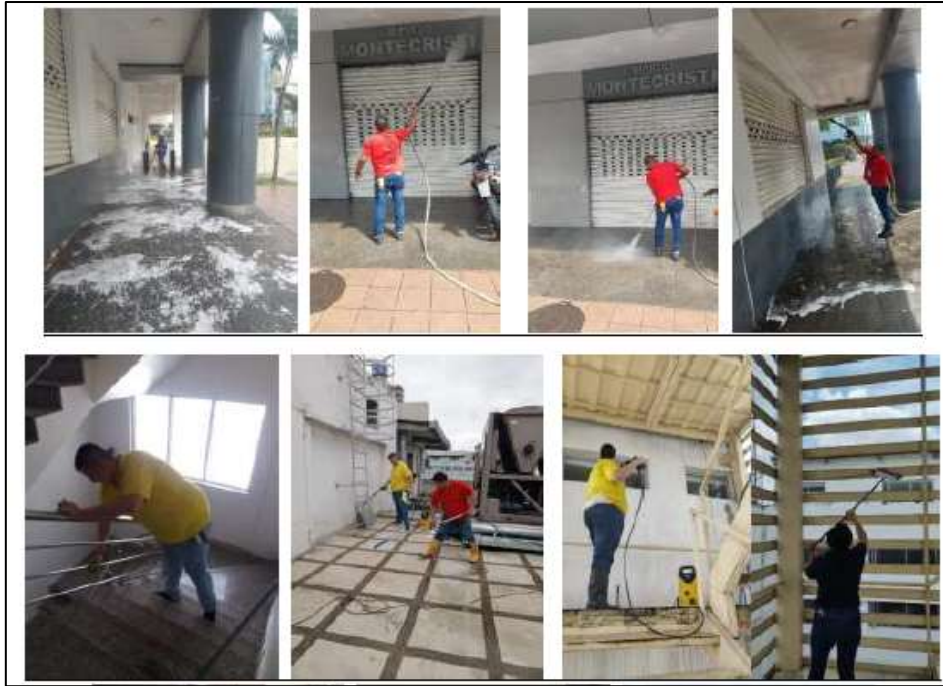
Figura 4. Servicio de limpieza en todas las dependencias