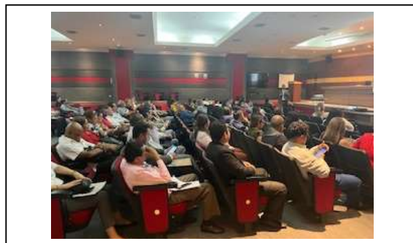
Figura 12. Evento Código de Ética