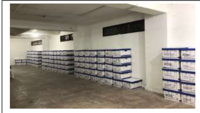
Figura 2. Sótano de la dependencia de La Garzota

En el mes de diciembre 2023 la Unidad de Archivo Central recibió 100 perchas del total de 652 que fueron adquiridas para la ubicación de 7.874 contenedores.