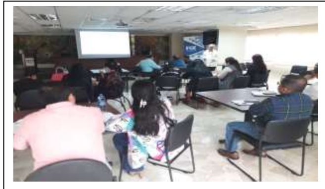
Figura 10. Evento Sistema de Responsabilidad Penal para Adolescentes y Justicia Juvenil Restaurativa