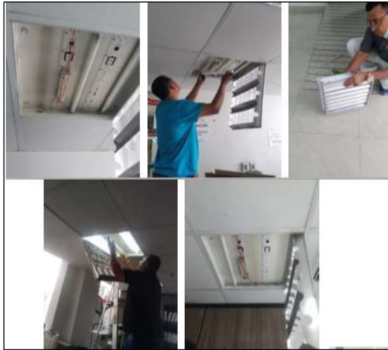
Figura 6. Trabajos de Mantenimiento en las diferentes dependencias