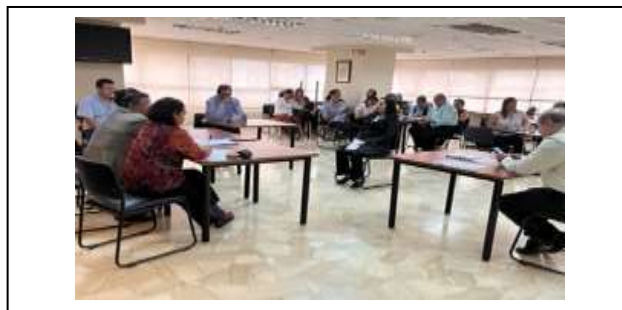
Figura 11. Evento Trata de Personas