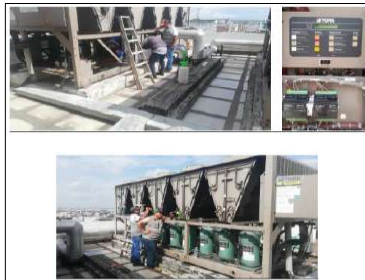
Figura 5. Mantenimiento preventivo y correctivo del sistema de climatización del edificio Montecristi