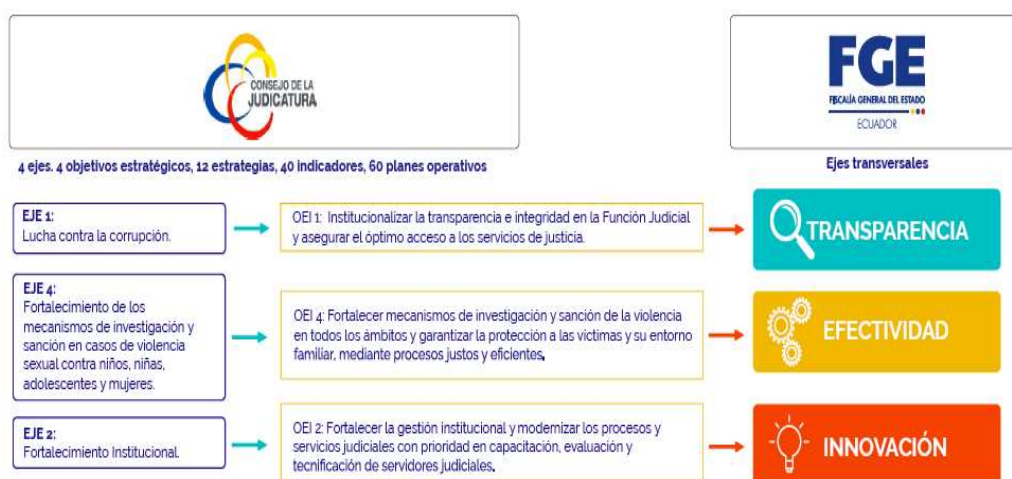
Ilustración 2 Alineación con el PEI Función Judicial – Fiscalía General del Estado

A continuación, se detallan las principales acciones y resultados de la gestión institucional al 31 de diciembre de 2023 de la Fiscalía General del Estado, en concordancia con los ejes de gestión.