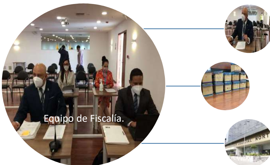
Gráfico 4.- Fotografías audiencia preparatoria de juicio caso “Rebelión”