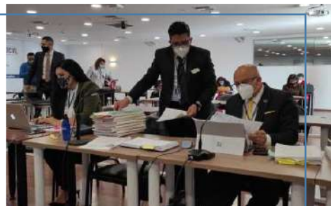
Alegato de cierre.