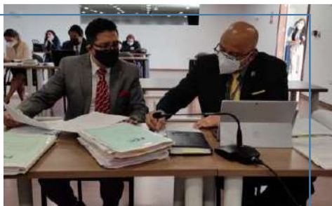
Instalación del juzgamiento.