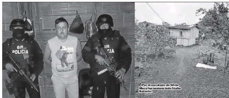
Imagen 9. Lugar de los hechos.