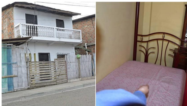
Imagen 8. Lugar de los hechos. Fuente Propia