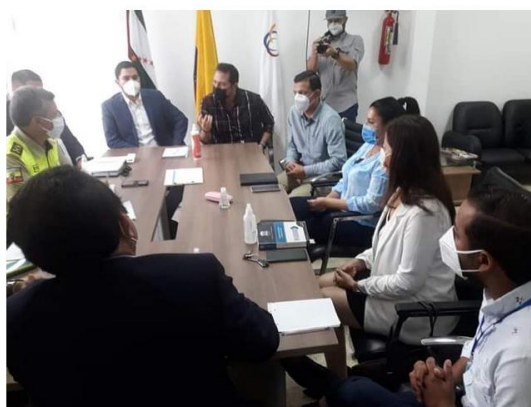
Imagen 3. Reuniones interinstitucionales en el año 2020.

Se fortaleció la participación de la Fiscalía Provincial de Manabí, a través de la participación activa en las diferentes mesas inter – institucionales, con los demás actores de la administración de justicia, Policía Judicial, Antinarcóticos, DEVIF, DINASED, DINAPEN, Criminalística, UIAN, Defensoría Pública Penal, Defensoría del Pueblo, Corte Provincial de Justicia de Manabí, Secretaría de Derechos Humanos, Gobernación, Ministerio de Salud de Pública, Organizaciones de la sociedad civil; con la finalidad de coordinar el trabajo y obtener mejores resultados.