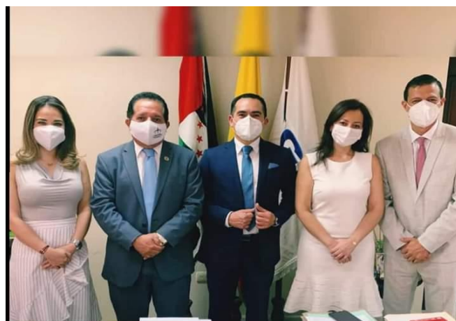
Imagen 4. Reuniones interinstitucionales en el año 2020.