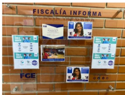
Imagen 1. Cartelera informativa ubicada en la entrada.