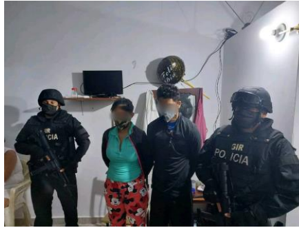
Imagen 7. Lugar de los hechos.