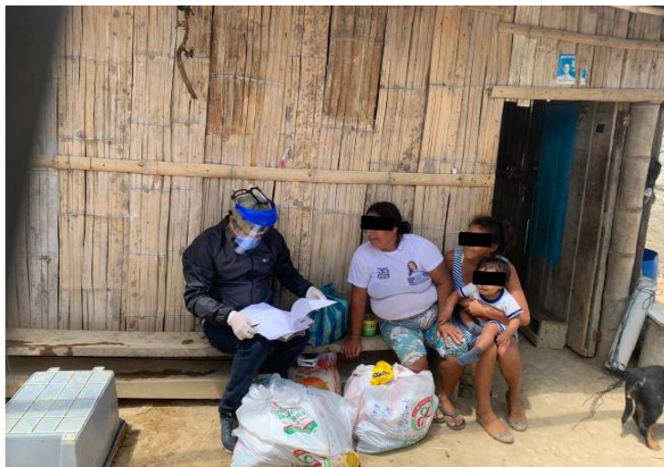
Imagen 2. Visita de campo a los protegidos del SPATV.