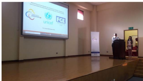
Imagen 10. Capacitaciones realizadas.