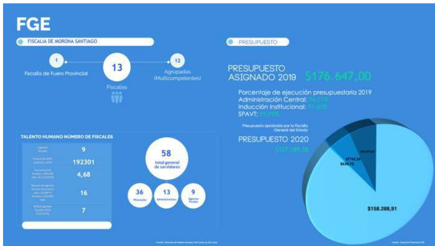
Gráfico: Ejecución Presupuestaria