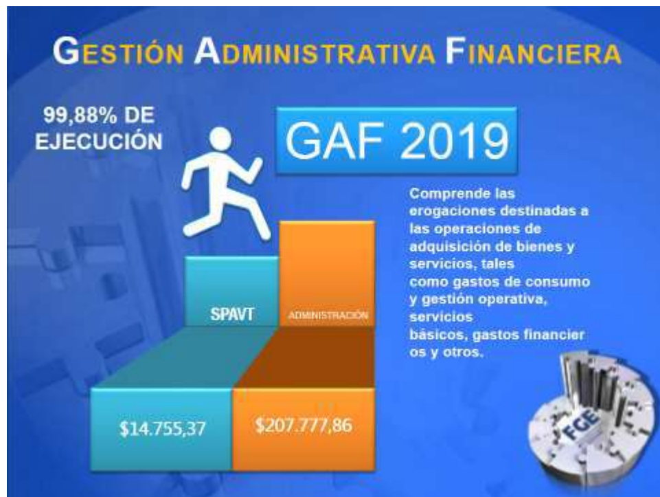
Gráfico: Ejecución Presupuestaria